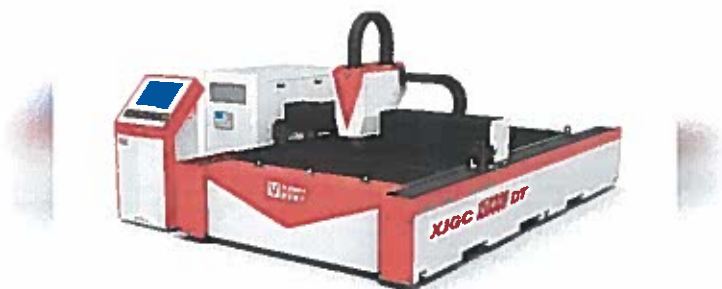
Machine découpe laser

Il s'agit d'investissements réalisés par la PME Plimetal dans du matériel de pointe de découpe laser fibre, de contrôle et de soudure. Cet investissement est le dernier d'un programme lancé en 2012 au sein de l'entreprise qui vise à augmenter la compétitivité, à accéder à de nouveaux marchés, à concevoir ainsi qu'à fabriquer des produits innovants, notamment dans les domaines de l'éco-énergie, des systèmes électrotechniques, du ferroviaire et de la monétique. A terme, l'entreprise devrait recruter 4 personnes.